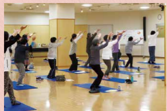
モンゴル伝統療法「モンゴルヨガ」で心と身体をリフレッシュ(4月12日開催)