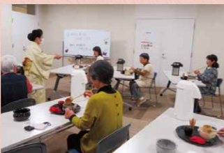
お抹茶を楽しみ心のゆとりを！(3月28日開催)

講座の目的は、何かをはじめするための「きっかけ作り」。参加者の方に喜んでもらえる嬉しいですよ。(アオウゼサポーター)